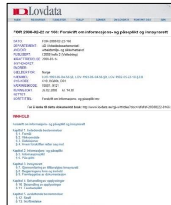
Forskrift om informasjons- og påseplikt og innsynsrett