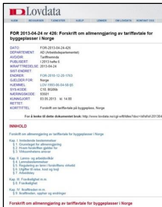
Forskrift om allmenngjøring av tariffavtale for byggeplasser i Norge